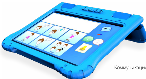
Коммуникационный планшет DPAD