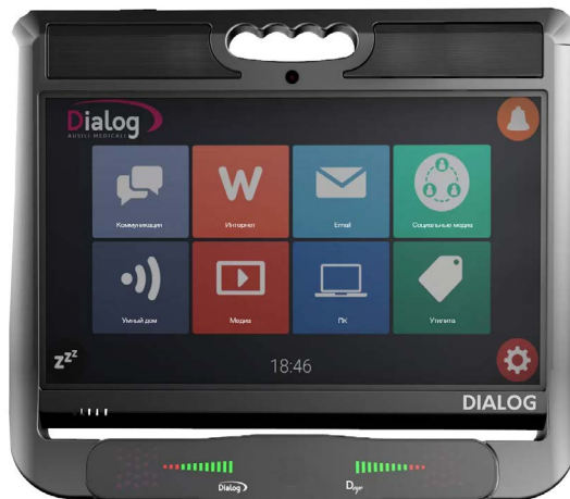
Коммуникационное устройство Dialog с айтрекером